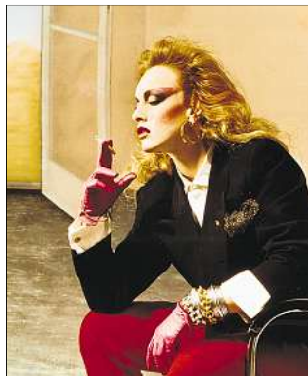
Lady Shiva en vestgadura da Thema Selection (1980).