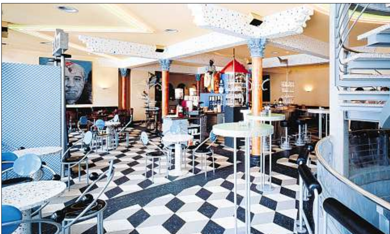
Il Scala a Tavau-Plaz (1986) dad Erwin Philippe.