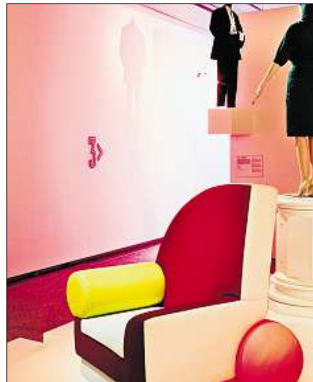
La pultruna giaglia «bel air» (1981) da Peter Shire. Davostiers moda taliana e svizra dal postmodernissem.