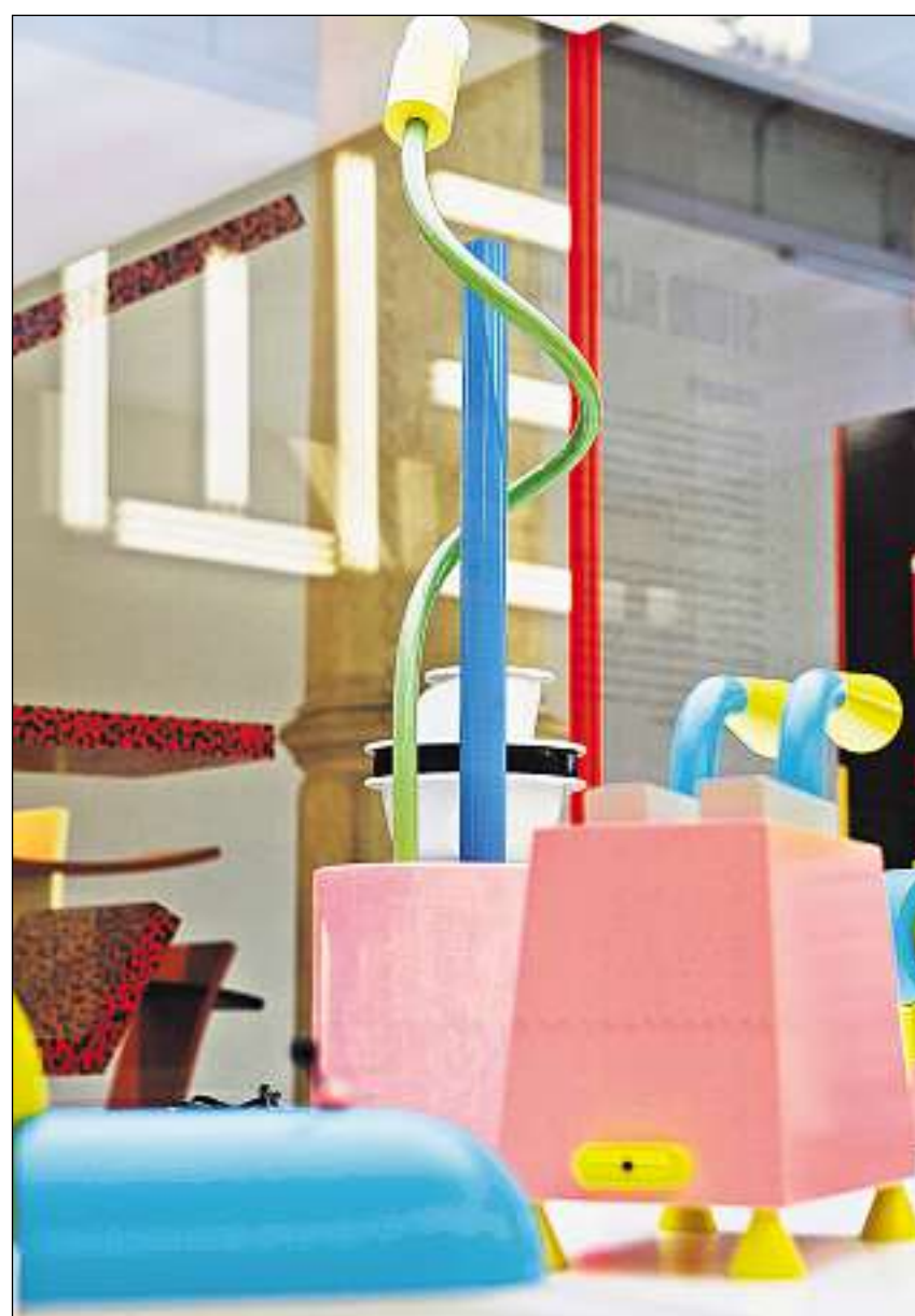
Sco termagls – il fier, il toaster e la cazzola dal designer Michele De Lucchi.

Il postmodernissem saja da chapir sco resposta sin la nivada e rigurusadad dal modernissem, pon ins leger en la documentaziun ch'il museum metta a disposiziun als visitaders. Entant ch'il modernissem spretschavia l'ornament, sa servivan ils postmodernists plain gust dad elements e chichergnims da stils ed epocas passadas. Ina varietad giaglia caracteriseschia questa fasa, en la quala tant la subversiuun dal punk sco er il hedonissem dals yuppies chattia ses plaz.